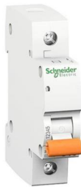
Gambar 2.5 MCB 1 Fasa

MCB adalah saklar yang berfungsi melindungi instalasi listrik dari lonjakan arus yang terjadi secara tiba-tiba. Kejadian over current biasanya disebabkan oleh hubung singkat dan beban lebih, MCB akan memutus rangkaian ketika terjadi gangguan tetapi ketika kondisi normal maka MCB dapat diaktifkan kembali seperti semula [14].