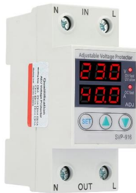
Gambar 2.6 Over and Under Voltage Protection

Over and Under Voltage Protection berfungsi sebagai pemutus tegangan lebih dan tegangan kurang agar memproteksi peralatan-peralatan listrik pada suatu rangkaian [16].