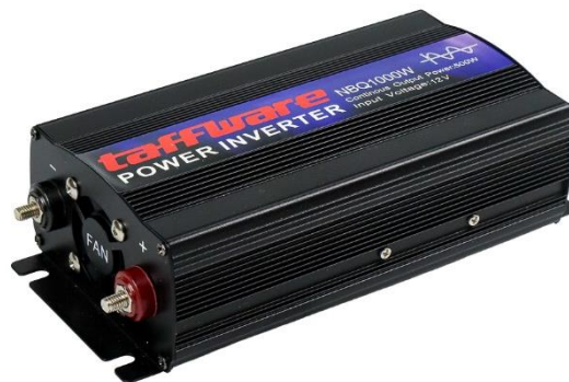
Gambar 2.2 Inverter

Inverter adalah salah satu perangkat elektronika yang dipergunakan untuk mengkonversi tegangan DC menjadi tegangan AC. Output inverter dapat berupa tegangan AC dengan bentuk gelombang sinus ( sine wave ), yaitu inverter yang memiliki tegangan keluaran dengan bentuk gelombang sinus murni, inverter jenis ini dapat memberikan supply tegangan ke beban (induktor). Kemudian ada gelombang sinus modifikasi ( sine wave modified ), yaitu inverter dengan tegangan keluaran berbentuk gelombang kotak yang termodifikasi, sehingga menyerupai gelombang sinus [4].