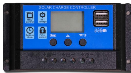
Gambar 2.3 SCC ( Solar Charge Controller )

melindungi dan melakukan otomatisasi pada pengisian baterai, hal ini bertujuan untuk mengoptimalkan sistem dan menjaga agar masa pakai baterai dapat dimaksimalkan. SCC dapat mendeteksi saat tegangan baterai terlalu rendah, bila tegangan baterai turun di bawah tingkat tegangan tertentu, maka SCC akan memutus beban dari baterai agar daya baterai tidak habis [10].