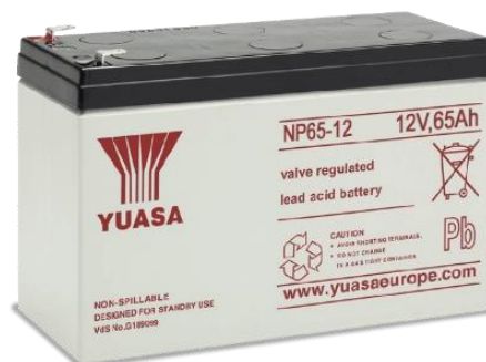
Gambar 2.4 Baterai atau Aki

Baterai atau aki adalah alat listrik-kimiawi yang menyimpan energi dan mengeluarkan tenaganya dalam listrik. Baterai di dalam sistem PLTS digunakan sebagai komponen penyimpan energi listrik arus searah (DC) yang dihasilkan oleh panel surya pada saat siang hari, lalu memasok ke beban listrik pada saat malam hari atau pada saat cuaca berawan [12].