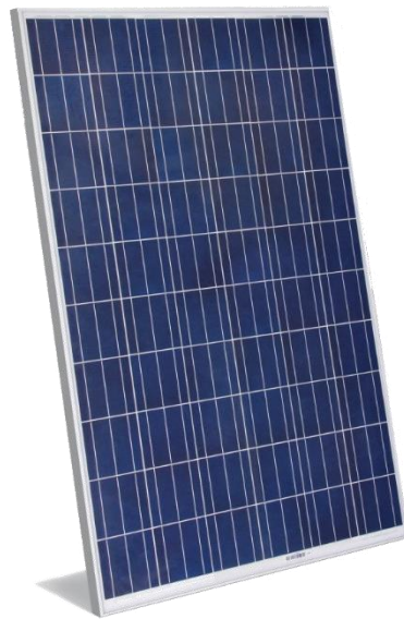
Gambar 2.1 Panel Surya

oleh cahaya matahari dapat menghasilkan arus listrik. Bahan semikonduktor merupakan bahan semi logam yang memiliki partikel berupa elektron – proton, yang ketika digerakkan oleh energi dari luar akan membuat pelepasan elektron sehingga menimbulkan arus listrik dan pasangan elektron hole . Panel surya mampu menyerap cahaya sinar matahari yang mengandung gelombang elektromagnetik atau energi foton. Energi foton pada cahaya matahari akan menghasilkan energi kinetik yang mampu melepaskan elektron – elektron ke pita konduksi, sehingga menimbulkan arus listrik. Energi kinetik akan semakin membesar seiring dengan meningkatnya intensitas cahaya dari matahari [8].