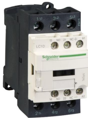
Gambar 2.7 Kontaktor

Kontak bantu dirancang lebih tipis sehingga hanya digunakan untuk bagian kontrol / kendali saja dengan arus listrik yang relatif kecil. Terdiri dari kontak NO (13 dan 14) dan kontak NC (21 dan 22) [18].