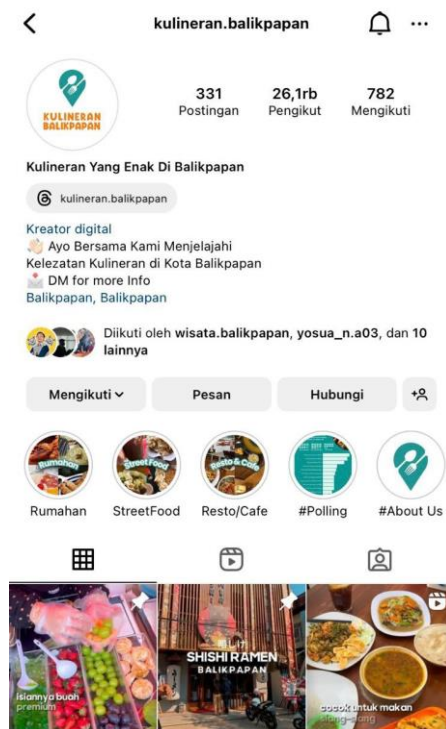
Gambar 2.3 food blogger kulineran. Balikpapan

kulineran balikpapan dalam menjelajahi wisata kuliner di Balikpapan mempunyai ciri khas nya tersendiri dalam mengolah hasil nya dalam melakukan hasil review yang menggabungkan wisata kuliner tradisional dan modern di dalam satu akun instagram miliknya, hal itu menyebabkan banyak sekali hasil wisata kuliner yang menarik dan wajib didatangi dalam berkunjung ke kota Balikpapan. Yang dimana salah satu food blogger nya sudah sangat ahli dalam jengjang kulineran di kota Balikpapan.