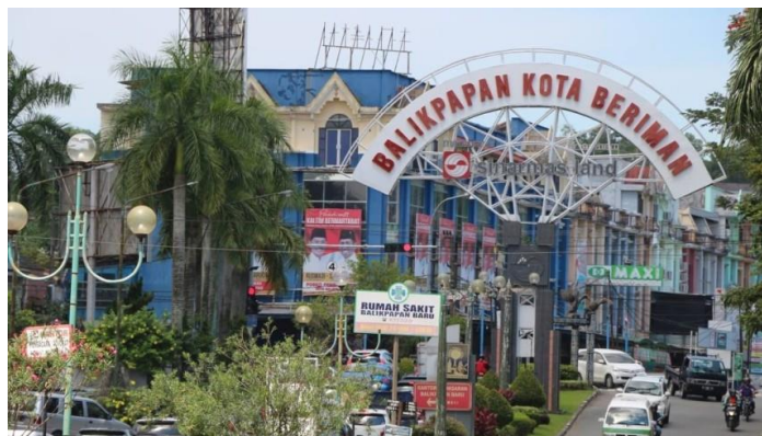
Gambar 2.1 kota Balikpapan

Kota Balikpapan adalah sebuah kota yang terletak di Provinsi Kalimantan Timur, Indonesia. Kota ini merupakan salah satu kota penting di Kalimantan Timur dan dikenal sebagai kota industri dan pelabuhan yang memiliki perkembangan ekonomi yang pesat, terutama dalam sektor minyak dan gas bumi (Matanasi, 2015). Sumur minyak pertama ini lalu dikenal sebagai sumur Mathilda. Penemuan sumber minyak juga tidak hanya terjadi di Balikpapan saja, tetapi juga di daerah lain di Kalimantan Timur, seperti Sanga-sanga, Samboja, dan Muara Badak. Wilayah – wilayah itu tadinya termasuk dalam kesultanan Kutai Kartanegara. Kemudian beberapa orang industrialis Belanda dengan dukungan pemerintah Hindia Belanda membeli tanah-tanah itu, untuk mendapatkan konsesi atas kekayaan yang ada di dalam tanahnya dari Sultan Kutai Kartanegara. Begitu juga Balikpapan yang sebelumnya termasuk dalam wilayah swapraja Kutai (Matanasi, 2015).