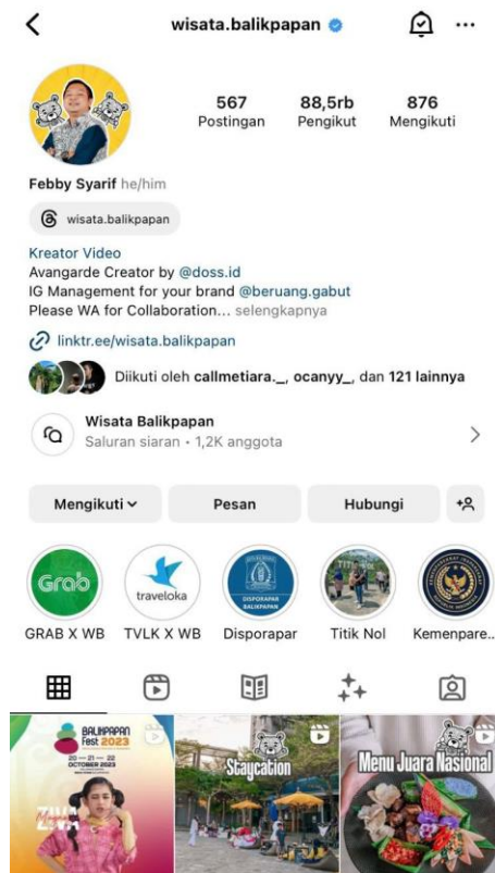
Gambar 2.2 food blogger wisata. Balikpapan

Food blogger satu ini yang biasa disebut juga beruang gabut , dalam memperkenalkan wisata kuliner memiliki ciri khas tersendiri dalam membuat konten vidio yang mencampurkan destinasi wisata di Balikpapan dengan wisata kuliner nya yang menarik dan wajin dikunjungi apabila datang ke kota Balikpapan. Dengan memiliki pengikut 88,5 ribu wisata.balickpapan dan sudah diakui hingga salah satu food blogger yang mendapatkan centang biru dapat dikata kan salah satu food blogger yang terkenal di kota Balikpapan. Food blogger tersebut bukan hanya bergerak di bidang wisata kuliner di Balikpapan, tetapi juga salah satu dosen di politeknik negeri Balikpapan jurusan Pariwisata yang memang mengetahui dasar tentang pertumbuhan wisata kuliner di Balikpapan.