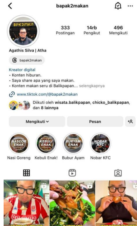
Gambar 2. 4 food blogger bapak2makan